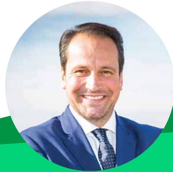
JAIME OZORES (ESPAÑA)